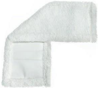
SERPILLÈRE PLATE LISSE

Serpillère en microfibre idéale pour le nettoyage des surfaces lisses et délicates (parquets, panneaux, revêtements en PVC). Elle est adaptée pour le balayage à sec, le lavage avec liquide ainsi que le nettoyage des murs ou plafonds de la poussière.