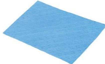
CHIFFON PERFORÉ 100 % VISCOSE

Chiffon universel pour essuyer à sec ou avec liquide. Idéal pour le lavage et le polissage. Fabriqué à partir de tissu non-tissé spécialement perforé qui absorbe parfaitement l'eau et la saleté.