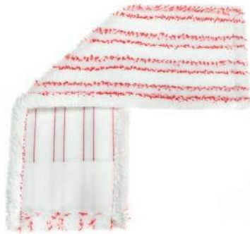
SERPILLÈRE PLATE EN MICROFIBRE À RAYURES

La serpillère en microfibre est idéale pour nettoyer les surfaces présentant des creux comme la terre cuite, le carrelage, et les sols à la structure irrégulière, ainsi que les surfaces lisses comme les parquets et les panneaux. Parfaite pour le balayage à sec et le nettoyage avec liquide. La structure à fibres de différentes longueurs facilite le nettoyage des creux du sol, et l'utilisation de fibres de polyamide aide à nettoyer même les surfaces très sales.