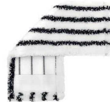
SERPILLÈRE PLATE AVEC UNE BANDE MÉLANGÉE

Nous pouvons configurer à volonté : fixations, poches, étiquettes et logos, et adapter les poids et les dimensions des matériaux aux spécifications du client