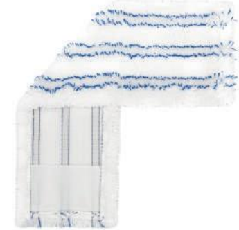
SERPILLÈRE PLATE EN MICROFIBRE À RAYURES

Nous pouvons configurer à volonté : fixations, poches, étiquettes et logos, et adapter les poids et les dimensions des matériaux aux spécifications du client