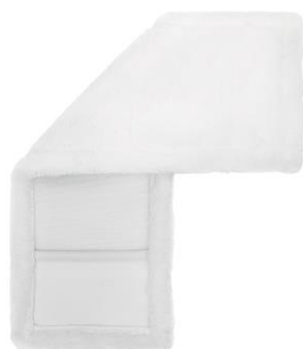
SERPILLÈRE PLATE À POCHE

Serpillère robuste et renforcée, ramassant même les plus petites particules de saleté. Parfaite pour nettoyer les surfaces poreuses et lisses. Serpillère conçue pour une utilisation à sec ou avec liquide. L'utilisation de poches spéciales avec découpes facilite le montage et l'utilisation, tandis que les côtés renforcés garantissent une durabilité prolongée.