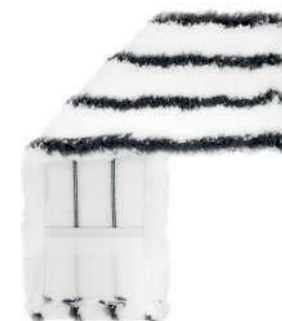
SERPILLÈRE PLATE AVEC TAMPON ABRASIF

Nous pouvons configurer à volonté : fixations, poches, étiquettes et logos, et adapter les poids et les dimensions des matériaux aux spécifications du client