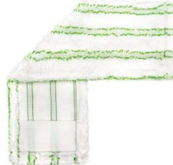
SERPILLÈRE PLATE EN MICROFIBRE À RAYURES

Nous pouvons configurer à volonté : fixations, poches, étiquettes et logos, et adapter les poids et les dimensions des matériaux aux spécifications du client