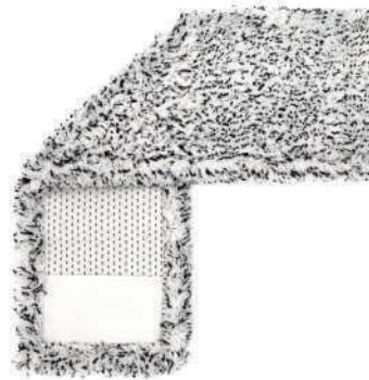
SERPILLÈRE PLATE MÉLANGÉE

Nous pouvons configurer à volonté : fixations, poches, étiquettes et logos, et adapter les poids et les dimensions des matériaux aux spécifications du client