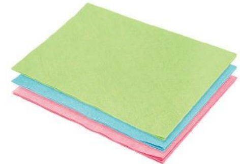
CHIFFON EN MICROFIBRE

Chiffon bien connu et apprécié pour un nettoyage rapide et efficace des surfaces en verre. Absorbe très bien l'eau et ne laisse pas de traces. Idéal pour le polissage, le nettoyage, la collecte de poussière et l'élimination rapide de l'excès d'eau des surfaces nettoyées. Un avantage supplémentaire est son séchage rapide après essorage. Ce chiffon est très résistant et a une large gamme d'applications.