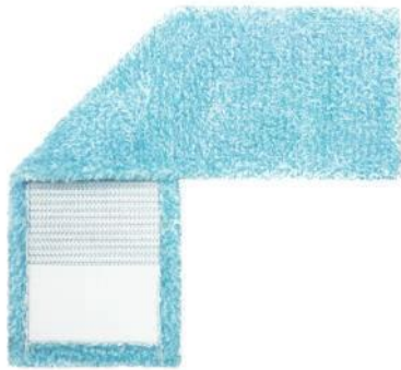
SERPILLÈRE PLATE BLEU MÉLANGÉ

La serpillère en microfibre mélangée est idéale pour le nettoyage des surfaces délicates et lisses telles que les parquets et le stratifié.