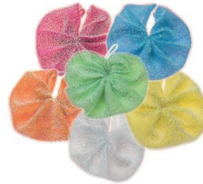
GANT DE BAIN

Un gant de bain utilisé pendant le bain pour masser et exfolier tout le corps. Grâce à sa structure, il élimine les cellules mortes de la peau qui se rincent facilement sous le jet d'eau. Sa large gamme de couleurs convient facilement à tous les utilisateurs.