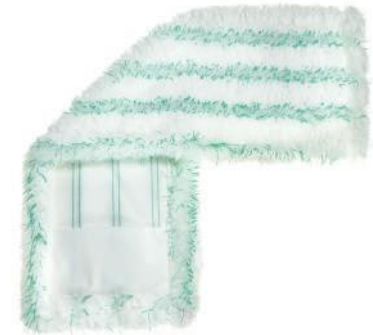
SERPILLÈRE PLATE MICROFIBRE-ULTRA

Nous pouvons configurer à volonté : fixations, poches, étiquettes et logos, et adapter les poids et les dimensions des matériaux aux spécifications du client