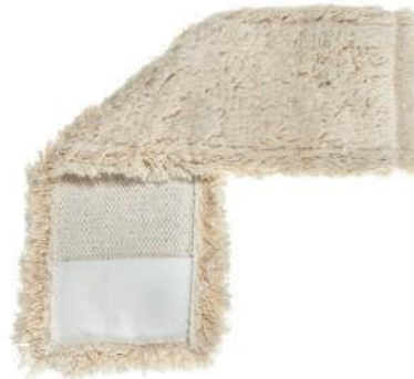
SERPILLÈRE PLATE EN COTON

Nous pouvons configurer à volonté : fixations, poches, étiquettes et logos, et adapter les poids et les dimensions des matériaux aux spécifications du client