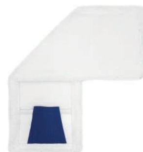
SERPILLÈRE PLATE AVEC POCHE ET LANGUETTES

Nous pouvons configurer à volonté : fixations, poches, étiquettes et logos, et adapter les poids et les dimensions des matériaux aux spécifications du client