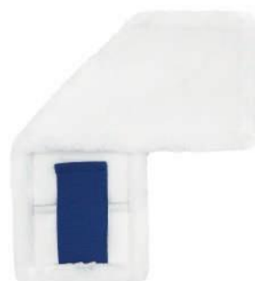
SERPILLÈRE PLATE AVEC POIGNÉES

Nous pouvons configurer à volonté : fixations, poches, étiquettes et logos, et adapter les poids et les dimensions des matériaux aux spécifications du client